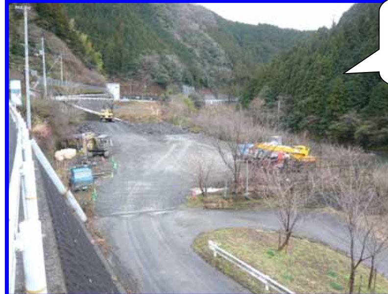
残土場 旧学校跡地 別件工事(岩井) 平行搬出