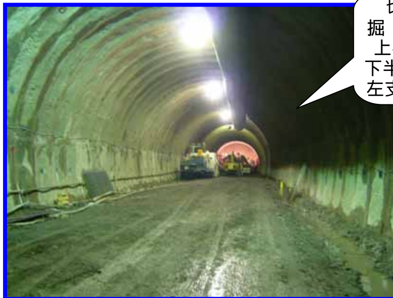
切羽状況 掘進(1/31)L=78m 上半支保工No.78 下半右支保工No.69 左支保工No.67まで