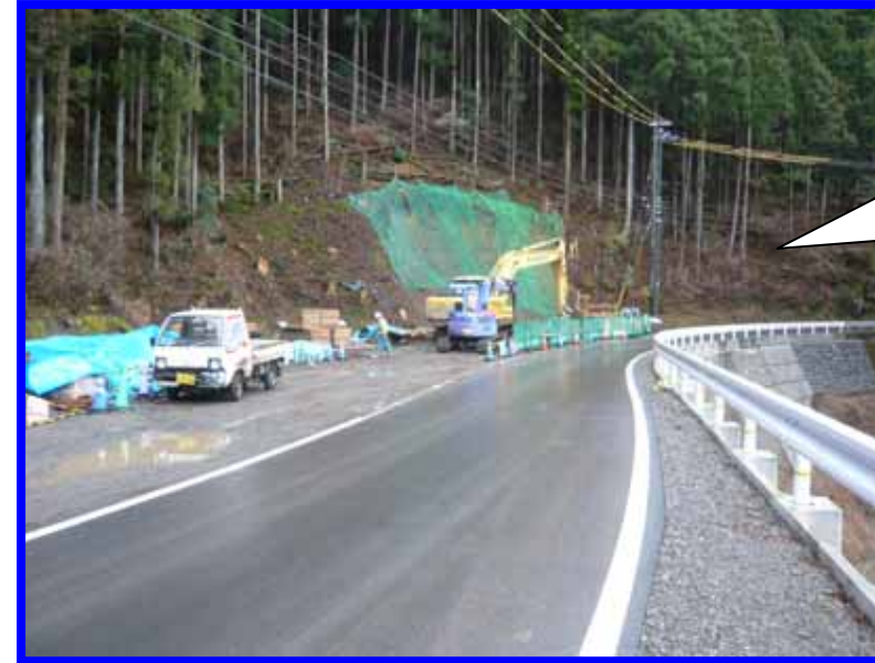
終点側 坑口付近 1/22より 抱擁壁着手 (岩井)